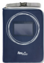
レブメイトキット