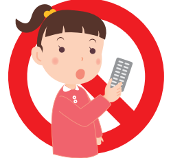
子供の手の 届かない場所に保管