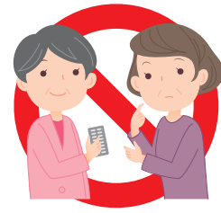
他の人に譲渡しない