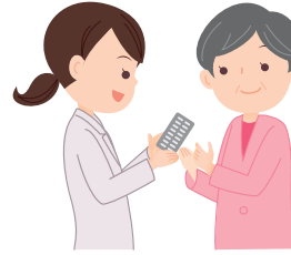
不要な薬剤は 薬剤部(院内薬局)へ返却