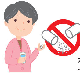
カプセルを開けずに そのまま服用する